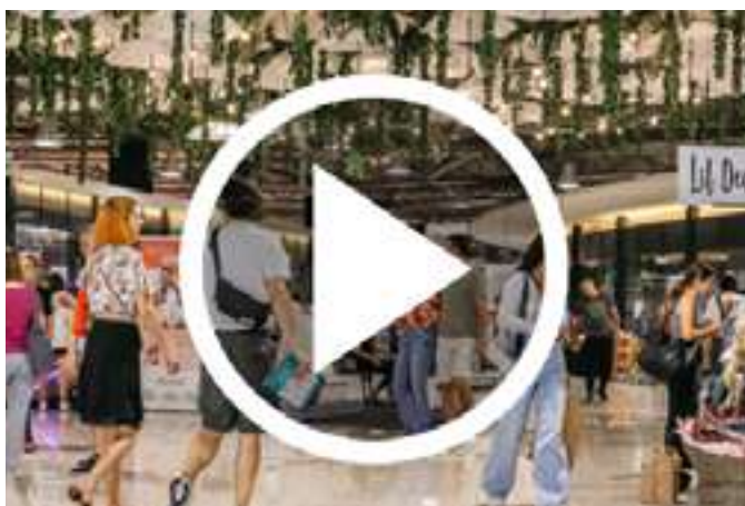
Video Sajam namještaja