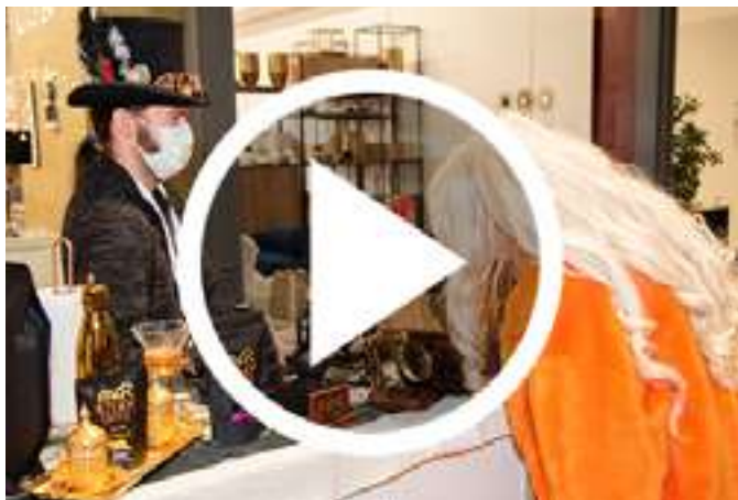
Video Sajam čokolade