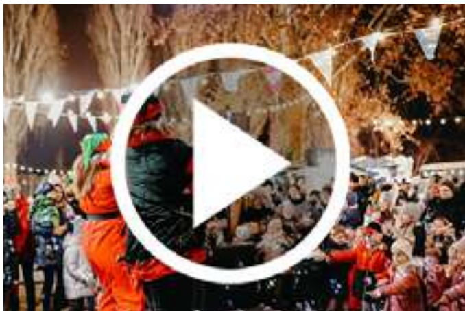
Video Božićni grad